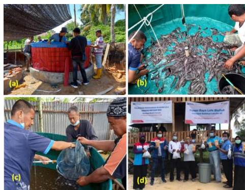
Gambar 4. Dokumentasi kegiatan produksi; a) Pemasangan kolam terpal; b) Sortir ikan lele; c) Panen ikan lele; dan d) Panen Raya Budidaya Ikan Lele