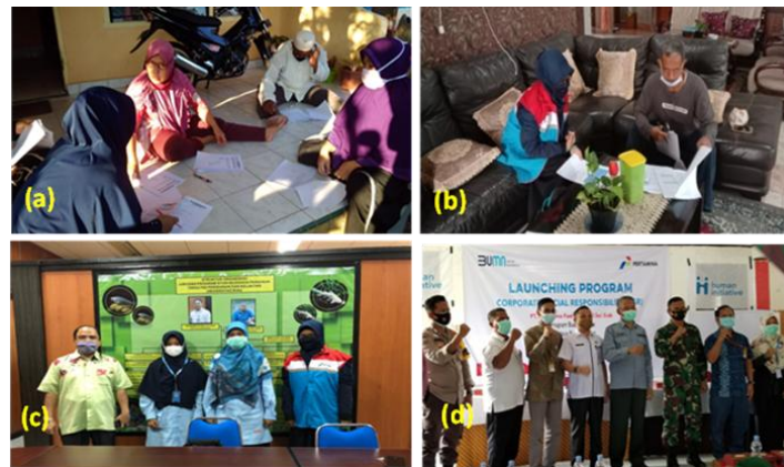
Gambar 2. Dokumentasi kegiatan; a) Asesmen peserta; b) Audiensi dengan Ketua RW; c) Diskusi bersama dosen, tim HI dan tim CSR PT Pertamina; d) Launching program

Selain itu, pendekatan partisipatif yang diterapkan selama pelaksanaan program (mulai dari pemilihan peserta, pelatihan, hingga evaluasi dampak) menguatkan posisi teori community-based development , yang menekankan pentingnya agency masyarakat lokal dalam menentukan arah perubahan sosial dan ekonomi. Dalam program ini, komunitas tidak hanya berperan sebagai penerima, melainkan juga sebagai pelaksana dan pengelola usaha, yang menunjukkan adanya transformasi peran dari beneficiary menjadi change agent (Hairunisyah et al. , 2024).