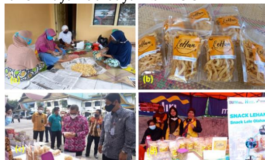
Gambar 5. Dokumentasi kegiatan produksi; a) Produksi snack lehan; b) Kemasan terbaru Snack Lehan; c) Bazar di Dinas Perikanan Provinsi Riau, dan d) Stand Bazar di Kantor Pertanian dan Perikanan Kota Pekanbaru