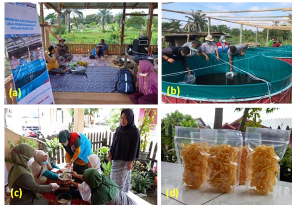
Gambar 3. Kegiatan Pelatihan dan pendampingan; a) Pelatihan budidaya ikan lele; b) Penebaran benih ikan lele pada kolam terpal; c) Pelatihan pengolahan ikan lele; d) Produk snack ikan lele

Keterbatasan-keterbatasan ini menjadi pelajaran penting dalam menyusun strategi pengabdian lanjutan yang lebih responsif terhadap kondisi nyata masyarakat sasaran. Interpretasi hasil program, oleh karena itu, harus mempertimbangkan bahwa sebagian capaian bersifat jangka pendek dan sangat tergantung pada dukungan intensif. Meski demikian, terbentuknya kelompok usaha dan produk olahan yang telah beredar di pasar lokal merupakan indikasi bahwa pondasi awal keberhasilan telah terbentuk, namun masih memerlukan penguatan pada aspek kemandirian, digitalisasi, dan konsistensi produksi.